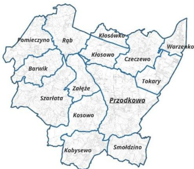
Rysunek nr 2. Gmina Przodkowo, podział na obręby geodezyjne.

Gmina Przodkowo zajmuje powierzchnię 8 539 ha, co stanowi 7,60% powierzchni powiatu kartuskiego oraz 0,46% powierzchni województwa pomorskiego.